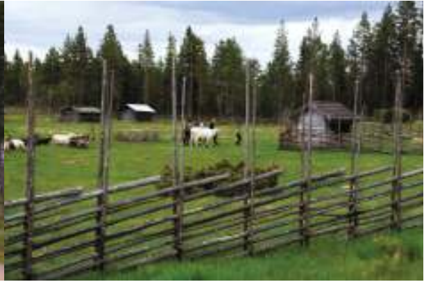
För att så småningom komma till Gessi fäbodar.