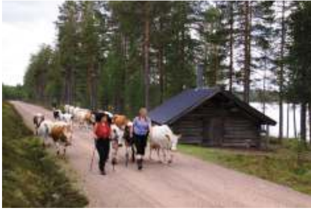
Buföring på gammalt hederligt sätt. Passerar Gessikojan.