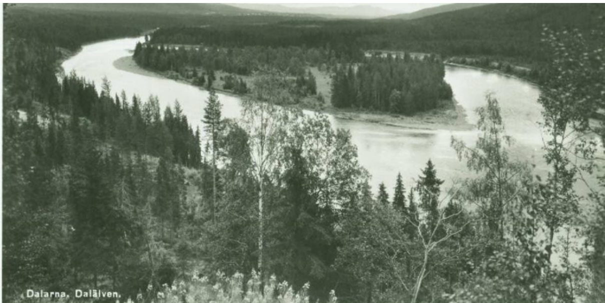
Vykortet ovan är daterat 1945.