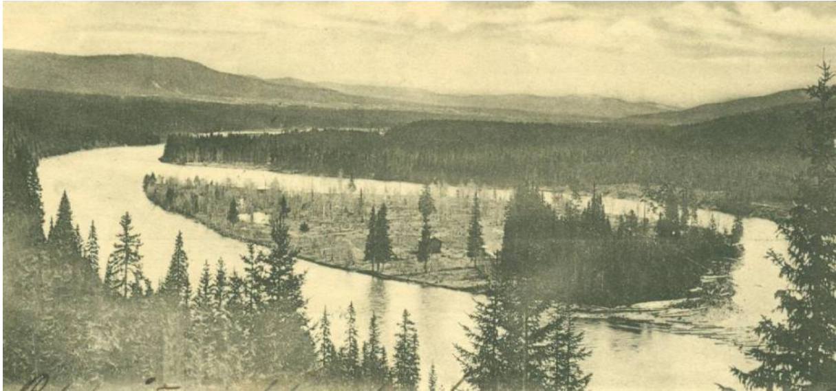
Vykortet ovan är daterat 1903.