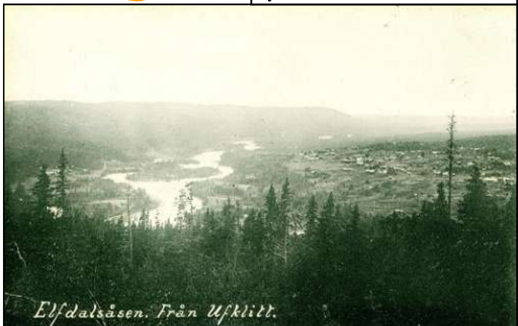
Elfdalsåsen. Från Ufklitt.

Jag och mina barn skulle besöka några vänner. På vägen stannade jag till för att ta ut lite pengar i bankomaten. Min femåriga dotter såg fascinerat på när hundralapparna matades ut. "Mamma", sa hon och svalde, "när du dör, kan jag få det där kortet då?"